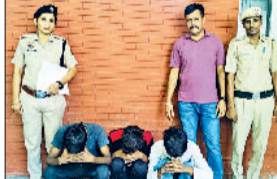
पकड़े गए आरोपी पुलिस गिरफ्तार में।