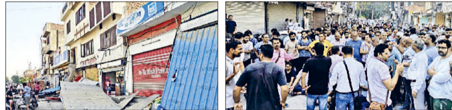
टोहाना। दुकानदारों के बाहर तोड़े गए शैड व अतिक्रमण हटाओ कार्रवाई का विरोध करते दुकानदार।