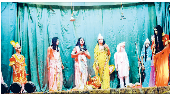
रतिया। रामलीला का मंचन करते कलाकार।