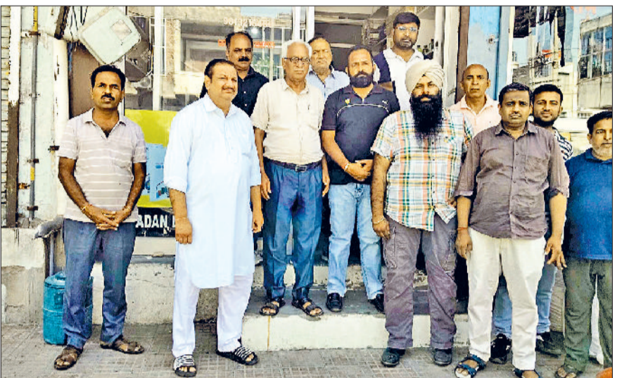
फतेहाबाद। बैठक में भाग लेते व्यापार मंडल के पदाधिकारी।

अब सवाल यह है कि तोड़फोड़ से नुकसान झेल चुके व दशहरे पर