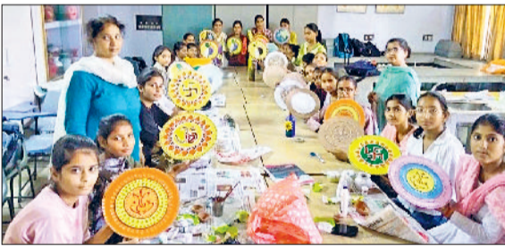
फतेहाबाद। महिला कॉलेज में आयोजित कार्यशाला में भाग लेती छात्राएं।