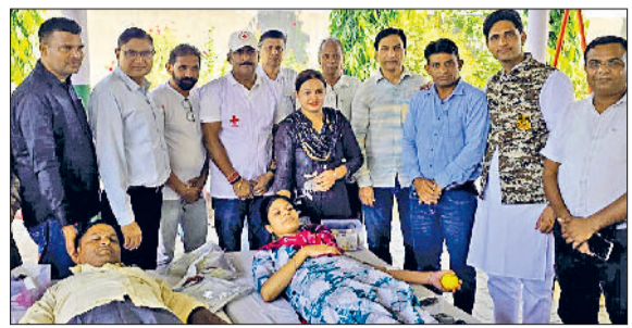
फतेहाबाद। रमणी रोही में रक्तदाताओं को प्रोत्साहित करते अतिथिगण।