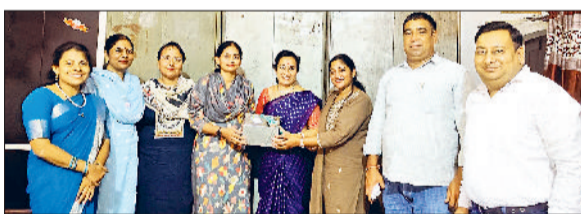
फतेहाबाद। गांव ढिंगसरा प्राथमिक पाठशाला में पहुंची कर्नाटक की शिक्षिकाओं का स्वागत करते स्टाफ सदस्य।

उन्होंने विद्यालय की प्रार्थना सभा, मिड दे मिल, कक्षा कक्ष, सफाई व्यवस्था, पेयजल व्यवस्था आदि को विस्तार से जाना और कर्नाटक के स्कूलों की गतिविधियों के बारे में जानकारी दी। उन्होंने विद्यालय में विद्यार्थियों के सर्वांगीण विकास को लेकर किए जा रहे प्रयासों और