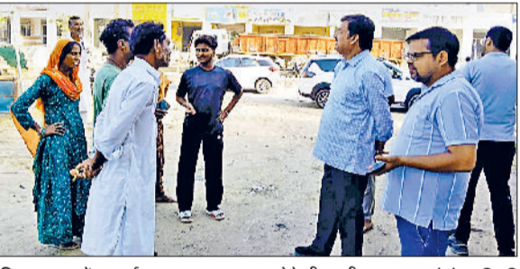
रतिया। शहर में सफाई व्यवस्था का जायजा लेते डीएमसी।

जिला नगर आयुक्त संजय बिशनोई ने शनिवार को नगर पालिका रतिया का निरीक्षण किया। इस दौरान उन्होंने शहर में विभिन्न स्थानों पर सफाई व्यवस्था का जायजा लिया। इस दौरान उन्होंने नागरिकों से अपील की कि सभी लोग अपने स्तर पर साफ-सफाई बनाए रखें तथा कचरे को गाड़ियों में अलग-अलग करके ही दें।