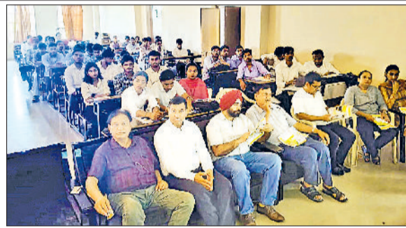
फतेहाबाद। विश्व रेबीज दिवस पर आयोजित कार्यक्रम में उपस्थित अतिथिगण।