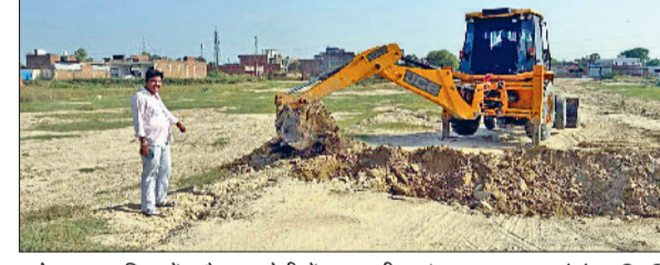
फतेहाबाद। रतिया में अवैध कॉलोनी में चलता पीला पंजा।

जिला नगर योजनाकार की टीम ने आज जिले के शहर रतिया में फतेहाबाद रोड पर 33 फुट रोड पर बिना मंजूरी के चार लोगों द्वारा चार एकड़ में काटी गई अवैध कॉलोनी के लिए बनाई गई दीवारों को जेसीबी की सहायता से गिरा दिया। साथ ही चोरावनी दी कि अगर बिना मंजूरी कॉलोनी काटी तो उसके खिलाफ कड़ी कार्रवाई की जाएगी।